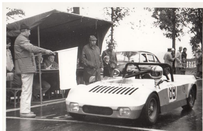
MISTROVSTVÍ ČSSR 1975 . VYSKEŘ U TURNOVA